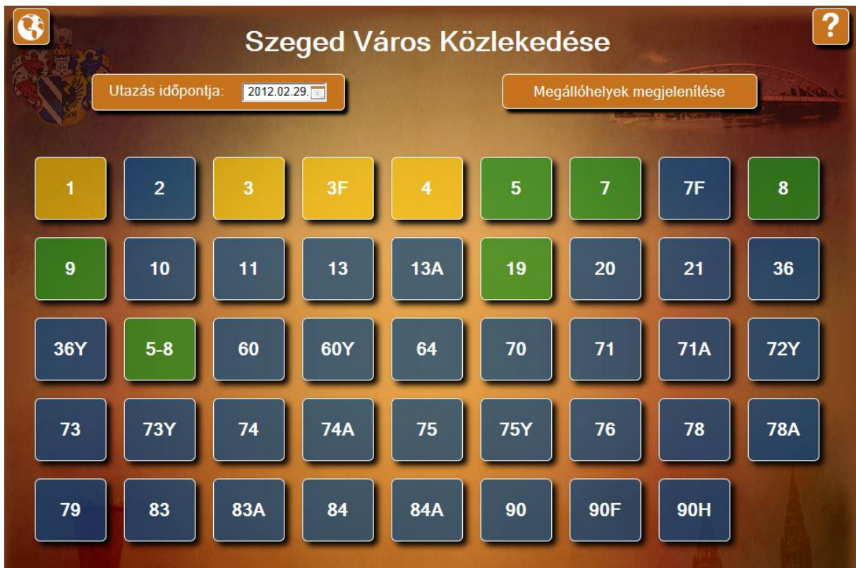
1. ábra Főképernyő