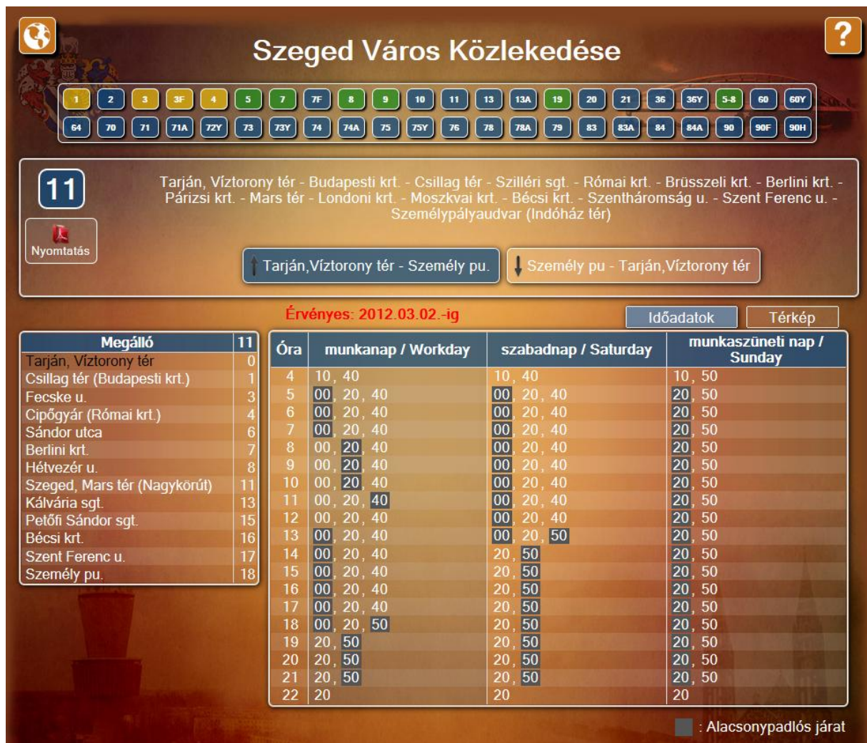
5. ábra Menetrend II.

A jobb oldali menetrend lista legalább egyik oszlopa minden esetben sötétebb, mint a másik. Ez jelzi, hogy melyik az adott napra érvényes menetrend.